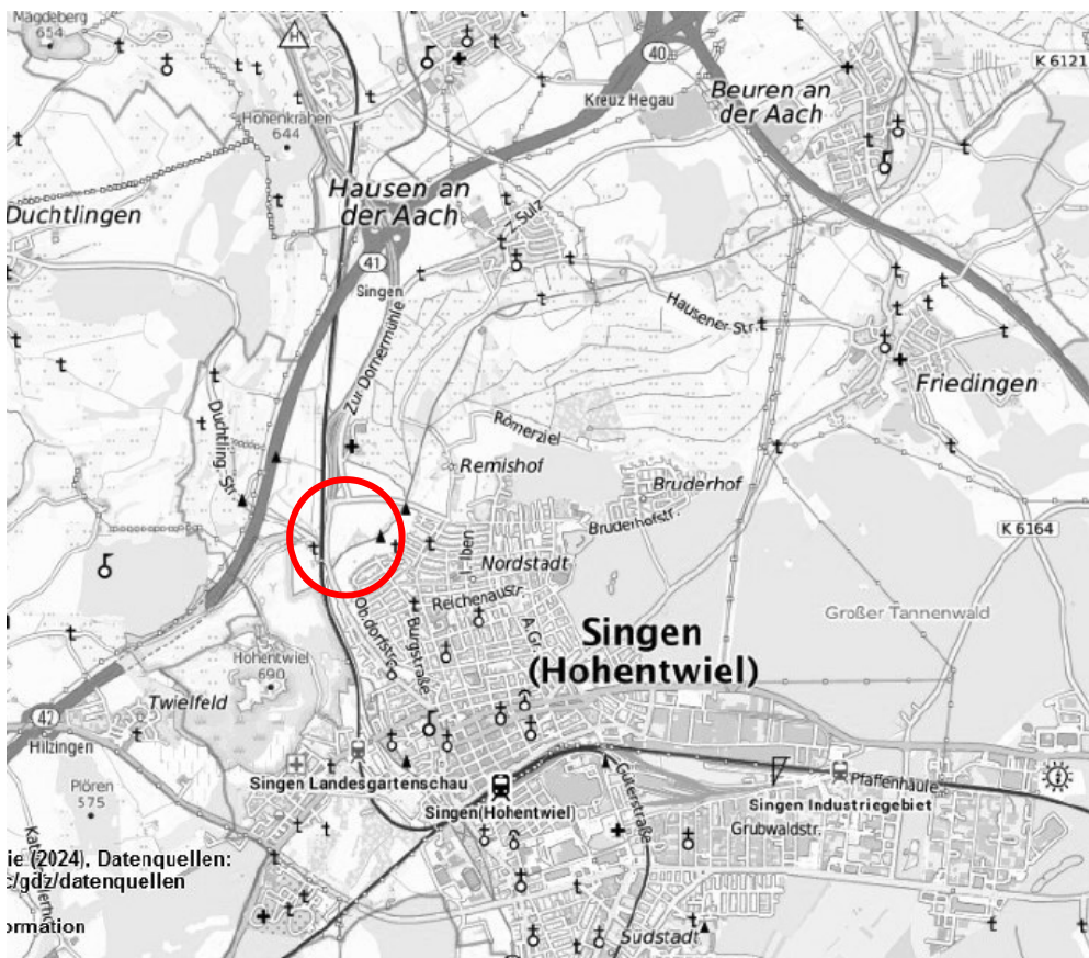
Übersichtsplan – ohne Maßstab

Das Plangebiet liegt am nördlichen Stadteingang Singens. Östlich der Schienenstrecke Singen - Engen liegt die geplante Sonderbaufläche Schienenhaltepunkt mit einer Fläche von ca. 1,1 ha. Östlich der L191, südlich der Nordstadtanbindung liegt die geplante Sonderbaufläche Krankenhaus (ca. 11,5 ha), die im Süden und Osten von den gärtnerischen Nutzungen im Bereich der Aach begrenzt wird. Die tatsächlich bestehenden kleingärtnerischen Nutzungen werden als Grünfläche dargestellt (ca. 1,1 ha). Die Gesamtfläche dieser FNP-Änderung beträgt ca. 13,7 ha. Die genauen Abgrenzungen ergeben sich aus der beiliegenden Plandarstellung.